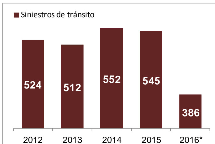
Gráfico I: Cantidad de siniestros de tránsito en todo el país